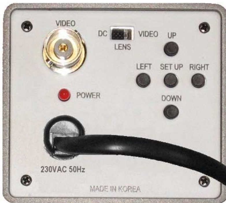
Figura 1: Collegamenti e tastiera OSD - Picture 1: Connections and OSD keyboard